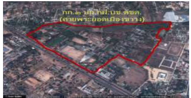
ภาพถ่ายทางอากาศที่ตั้ง กก.๓ บก.กฝ.บช.ตชด.

พื้นที่การฝึกกองอำนวยการฝึกภาคสนามตั้งอยู่ในพื้นที่ศูนย์ศึกษาการอนุรักษ์ทรัพยากรธรรมชาติและสิ่งแวดล้อม เจริญพระเกียรติสมเด็จพระเทพรัตนราชสุดาฯ สยามบรมราชกุมารี เนื่องในโอกาสทรงเจริญพระชนมายุ ครบ ๖๐ พรรษาบ้านนาเลิน ตำบลนาเลิน อำเภอศรีเมืองใหม่ จังหวัดอุบลราชธานี มีเนื้อที่ ๒๘๔ ไร่ ๑ งาน ๓๐ ตารางวา